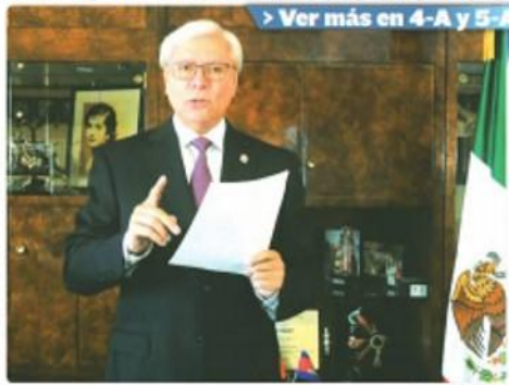
Ver más en 4-A y 5-A

El mandatario estatal sostuvo que "marzo fue un mes histórico para los y las boricuenses, porque después de un año desde el primer caso de COVID-19 en la entidad, la campaña de vacunación de adultos mayores llegó a los cinco mil