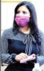
COMO UNA MUJER INFLUYENTE

Se perfila Montserrat Caballero en Tijuana