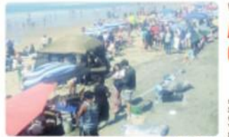
TIJUANA.- Con la asesoría de la Secretaría de Salud, se abrieron las playas al público, pero con medidas de vigilancia para que se cumplan con los protocolos de sana distancia y de protección sanitaria.