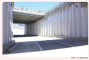
MEXICALI.- La SCT anunció la apertura este jueves primero de abril del paso de peaje que conecta a la nueva gestión de Calexico.

MEXICALI.- La Secretaría de Comunicaciones y Transportes (SCT), a través del Centro SCT Baja California, anunció que