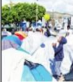
BUSCAN LOGRAR RETIRO VOLUNTARIO