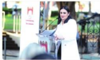
TIJUANA.- La alcaldesa realizó los avances que se han tenido durante los primeros días de su gestión.